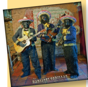
Une plainte mexicaine pour les gorilles

Quelque soit leur background, ce que l'on sait sur ces dos argentés buveurs de tequila, c'est qu'ils ont enregistré une chanson : 'Nous sommes des gorilles ! : Une plainte de Mariachi' - qui a pour but de faire prendre conscience de la menace qui pèse sur leurs cousins d'Afrique. Tout l'argent obtenu par la vente de leur disque sera généreusement reversé à la Gorilla Organization pour son travail continu consacré à la conservation et au développement. Rendez leur visite à www.mariachigorillas.com