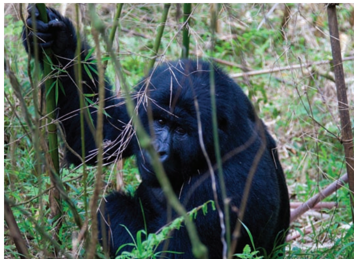
La mort d'un gorille dos noir cause une grande détresse en Ouganda