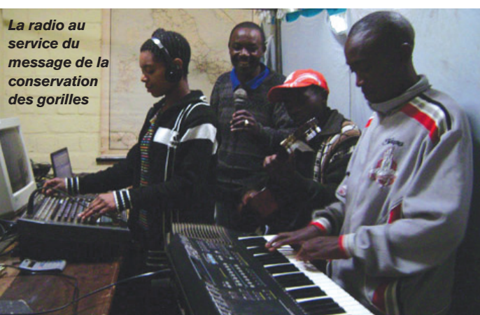
La radio au service du message de la conservation des gorilles

« Ce prix montre l'appréciation sur notre travail de communication, » a déclaré Tuver, « les