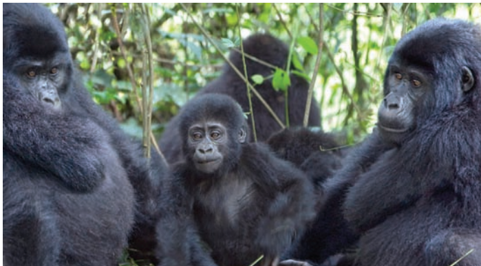
Les données de recensement semblent indiquer que la taille des groupes de gorilles de montagne augmente