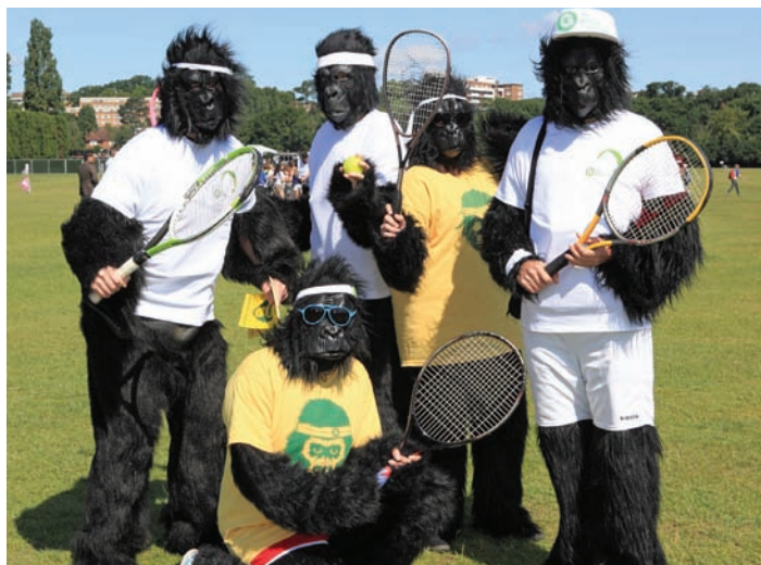
Le tennis de singe ? Pas tout à fait : La Team Gorille en route pour Wimbledon

La "Team Gorille" a ensuite pris la route pour un été de festivals de musique. En tout, les gorilles étaient présents à sept des plus grands événements de la saison estivale, dont Glastonbury, Hop Farm, Latitude et Reading et Leeds. Tout en