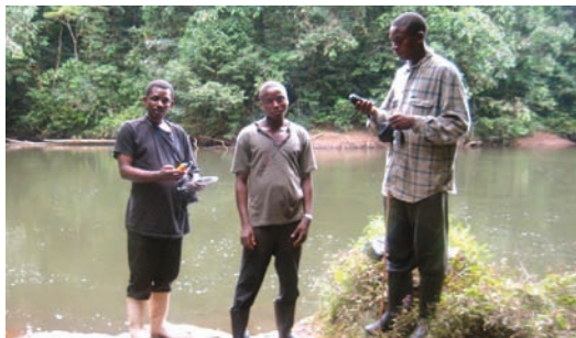
La Réserve de la Communauté de Walikale : La Conservation communautaire en action

« Les forêts de communauté comme Walikale ont, au contraire, été créées par les gens de la localité très motivés d'avoir leur mot à dire en ce qui concerne leur propre avenir. Maintenant, ces communautés ont une motivation pour sauvegarder la forêt et pour s'assurer que les frontières qui les séparent des gorilles sont bien respectées. »